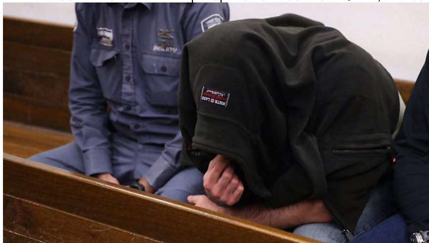
"לא זוכר את המתלוננת". הגינקולוג החשוד בבית המשפט

על הטענה כי במהלך החקירה הסמויה שלחה המשטרה סוכנות סמויות לקליניקה שלו כדי שיעברו תקיפה מינית אמר הרופא: "אני לא יודע מי אלה הסוכנות הסמויות ואם היו. את זה צריך לשאול את המשטרה. בכל מקרה לי לא הציגו כל עדות סרטון או תיעוד של הסוכנות הסמויות כפי שנטען שנשלחו". בעקבות מכתב ששלחה ח"כ מיכל רוזין (מרצ) למשרד לביטחון פנים, ובו התלוננה על השימוש שנעשה בסוכנות משטרתיות, הודיעו אמש בלשכת השר כי ביקשו לקבל הבהרות בנושא מהמשטרה.