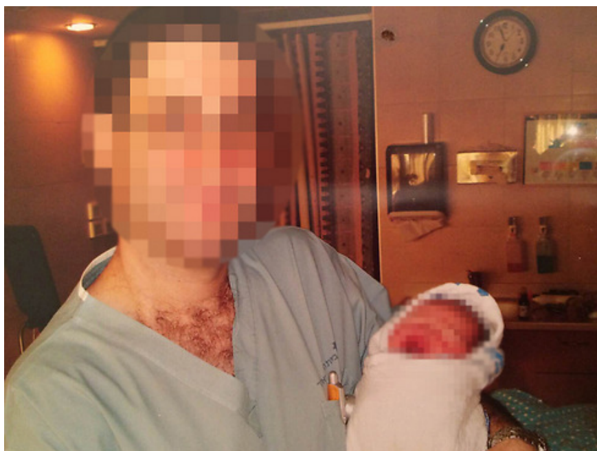
שוחרר ושב לעבוד. הגינקולוג

לאחר ששחרר שלשום ממעצר של חמישה ימים בחשד לביצוע מעשים מגונים באחת המטופלות שלו, הגינקולוג שנעצר מתעקש כי לא עשה שום דבר פסול, אלא נקט הליך רפואי מקובל, ומנסה לחזור לשגרה. "מעולם לא עבר לי בראש שמטופלת תגיד שהיה אונס", אמר אתמול (יום ב'), יממה לאחר שחרורו ממעצר, "כל טיפול שביצעתי היה על פי הספר".