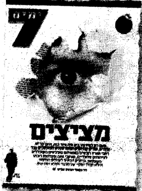
נובמבר 2010: התוכנה נחשפת במוסף "7 ימים"

החליטה המשטרה לשים יום האחרונים פשטו חוקי הארצית לחקירות הונאה 1 משרדי חקירות ובתי עסק תוכנות הריגול המיועדות כמים (סמארטפונים). 22 ירו, מרביתם חוקרים פרי, בחשד שהפיצו והתקינו לצורך האזנת סתר, פגיעה ירה לחומר מחשב וקשירת פשע.