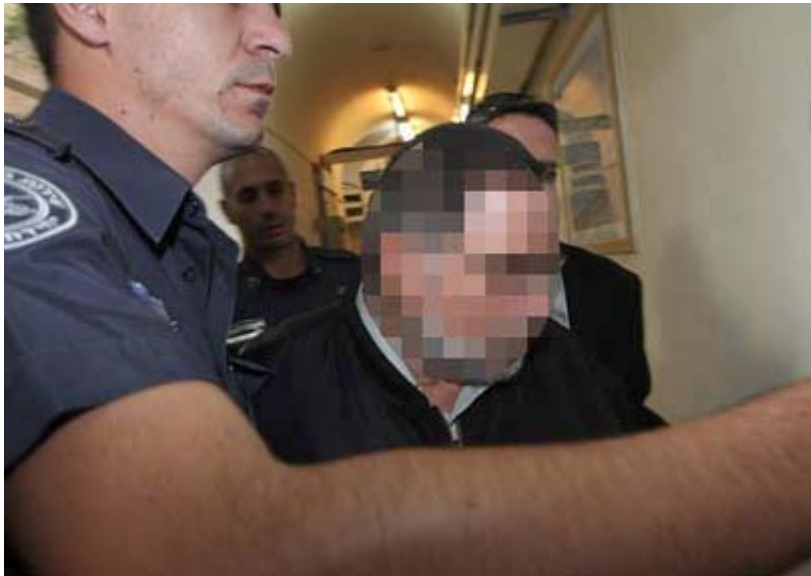
החשוד. טוען שהכול היה בהסכמה

בדיון נאמר כי המתלוננת, שמתגוררת באשקלון, מנהלת אורח חיים דתי. היא סיפרה כי החשוד אסף אותה באופנועו והשניים נסעו לירושלים, שם ערכו סיור בכנסת, במנהרות הכותל, ביקרו בקריית הממשלה והמשיכו לביתו של החשוד בירושלים. על פי טענת המשטרה בוצעו העבירות בביתו של החשוד בירושלים, וכשעה לאחר ביצוע המעשה, לכאורה, שלח הבכיר מסרון למתלוננת ובו שאל אם "הכול בסדר?" ו"שהיה כיף". המתלוננת ענתה בחיוב.